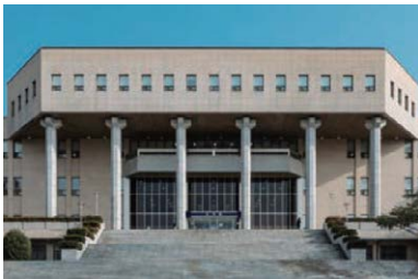
도서관 열람석 4,533석