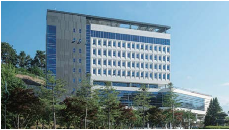
삼척 캠퍼스(도계 포함) (면적 630,517㎡)