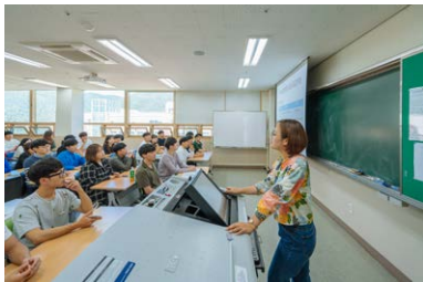
첨단강의실/총강의실 473/533개 (89%)