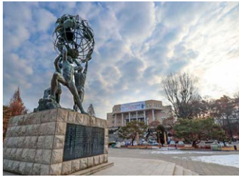
춘천 캠퍼스 (면적 1,001,311㎡)